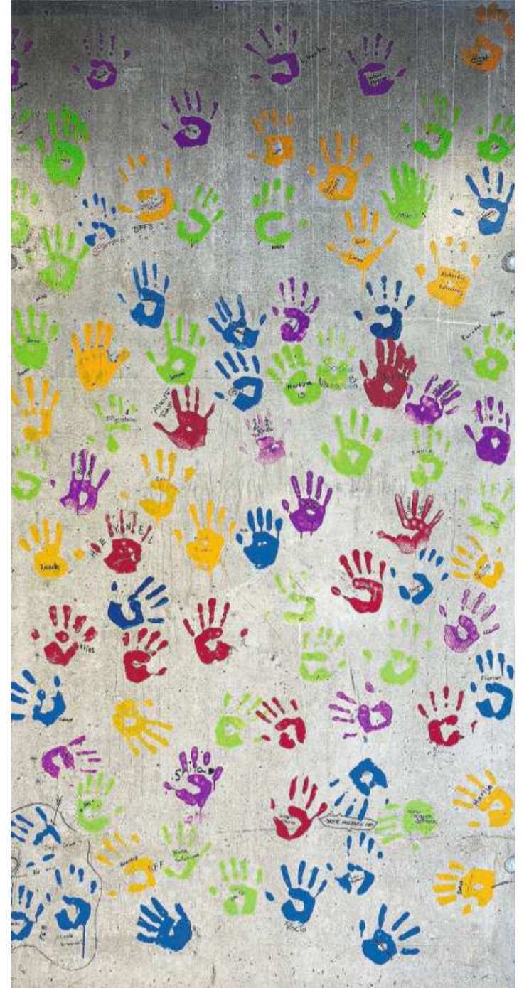
Die Tagessonderschule der Stiftung Buechweid im zürcherischen Russikon gehört zu den Institutionen, an denen die Methodik der Neuen Autorität angewandt wird.